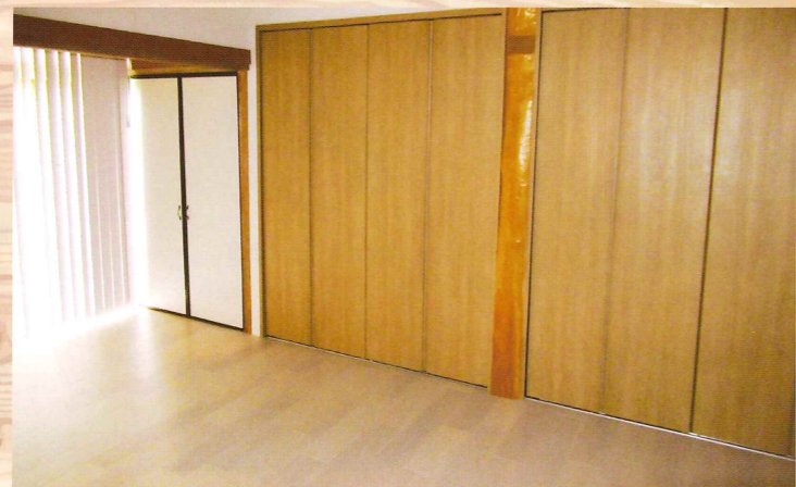
障子も取り外し広い洋室に完成

大工仕事について、高所作業等はお受けできない場合があります。お仕事をする前に、細かい打ち合わせと見積をさせていただきます。ご確認をいただいてからお仕事をさせていただきます。大工会員さんが少ないため、お待ちいただくことがあります。