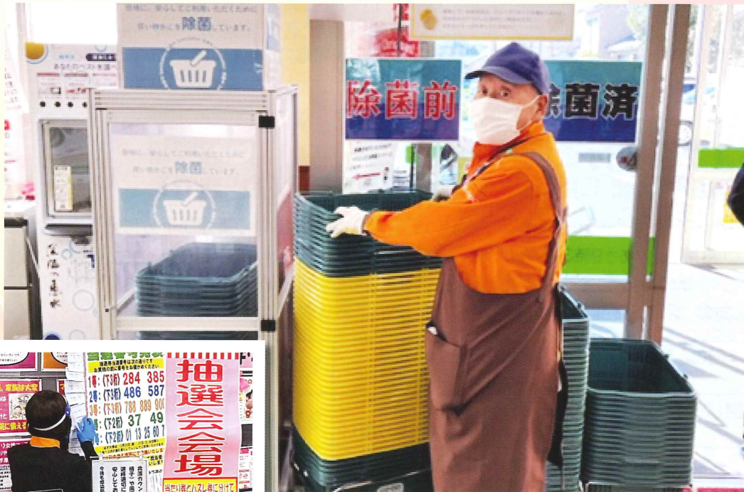
SHIPPINGカート・カゴ回収